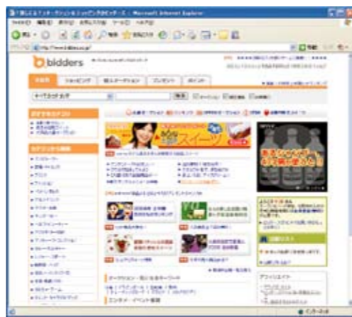
一ヶ月420万人が訪れる! biddersサイト

でもホームページを立ち上げたり、モールの出店されたりと積極的に取り組まれている方もいらっしゃると思いますが、パソコンの扱いに不慣れだったり、高速回線が未整備だったり、なかなか取り掛かれない事業者の方も多いのではないのでしょうか。そこで、当センターでは、「電気のあるさとじまん市」の店舗をネットモール大手の「ビidders」に出店し、センターが中心となって、電源地域の特産品や名産品をネットモールの販売することとしました。