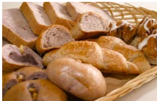
紫黒米が練りこまれたパン

なお、紫黒米、紫黒米素麺、紫黒米健康酢は地方発送できます。お立ち寄りの際には、ぜひお求めください。