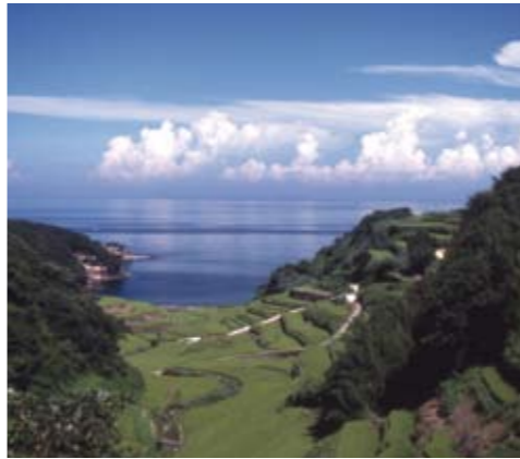
玄海町 浜野浦の棚田

二日目の地域振興事業検討会・分科会では、「地域資源開発」「地域経営戦略」といった切り口から電源地域の今日的課題を考えます。また、「玄海町をケースと