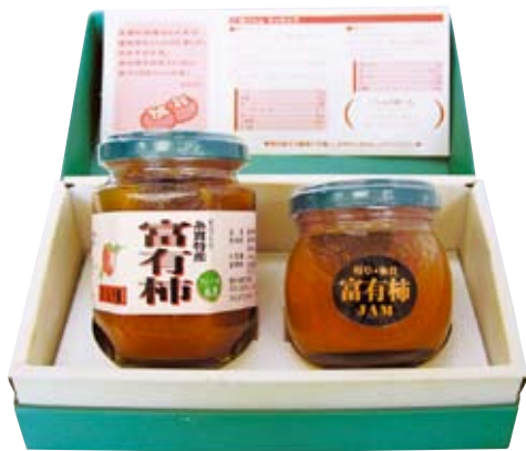
富有柿ジャムセット

本市は柿、イチゴ、水稲を主要農作物としており、なかでも富有柿は、全国的にも一大産地として知られ、明治時代から栽培されている特産品です。岐阜県が原産地で、