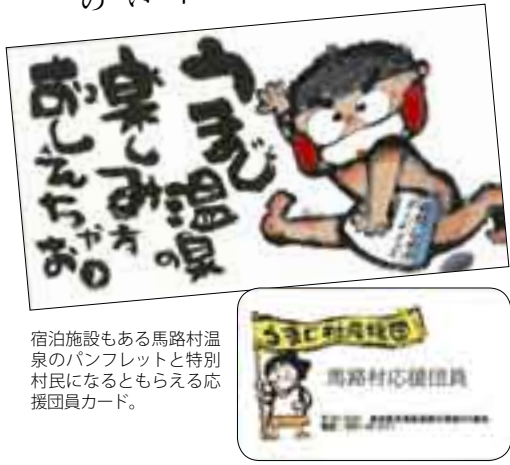
宿泊施設もある馬路村温泉のパンフレットと特別村民になるともらえる応援員カード。

に訪れた際には村長室で村長と「ごっくん馬路村」が飲め、記念写真が撮れる他、村の温泉無料入浴券が付くという特典があります。「募集を始めて五年になりますが、現在二千六百人もの特別村民がいます。これは村の人口の