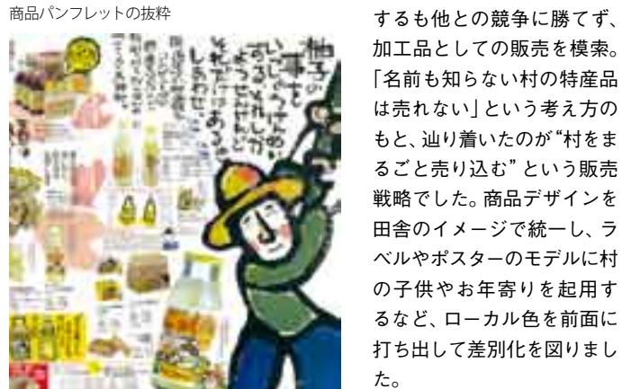
商品パンフレットの抜粋

馬路村はポン酢しょうゆ「ゆずの村」や、ユズジュース「ごっくん馬路村」などのユズ加工商品で全国にその名を知られています。平地が少ない村では、安定した収入が得られる農産物として昭和40年頃から馬路村農業協同組合が本格的にユズ栽培に取り組みました。当初は青果として販売