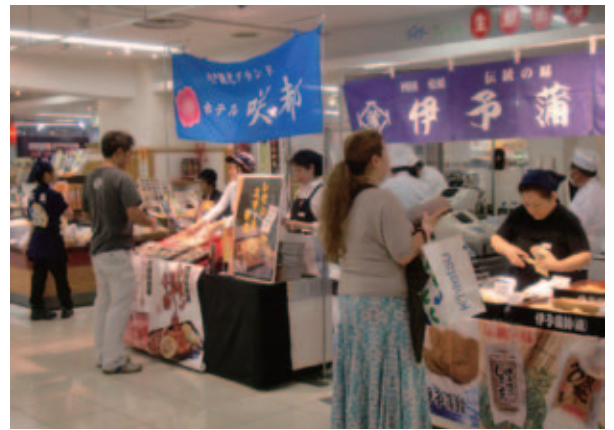
大阪・近鉄百貨店で開催

今年度は、他に東京会場、福岡会場等を計画しています。実施会場と調整がつき次第参加募集を行います。