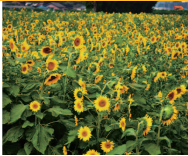
六貫山地区に咲くひまわり