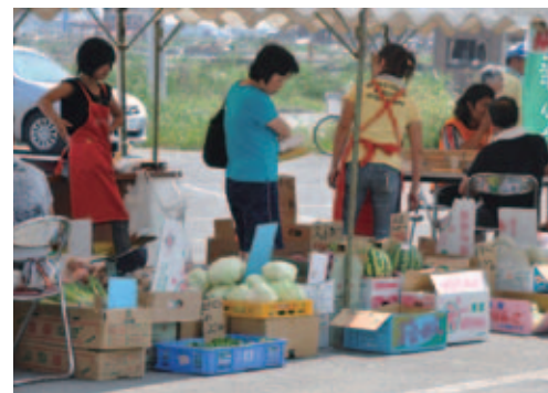
毎週水曜日に開催される