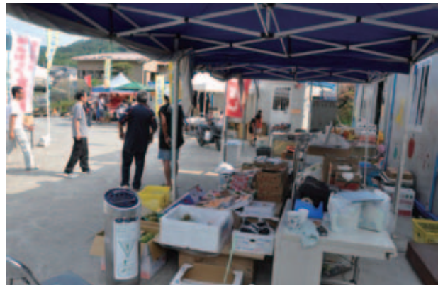
「コンテナ村商店街」

よって仮設資材の提供を広く求めたが、プレハブの仮設店舗は敷地を広く取ってしまい、建設が難しいことがわかった。