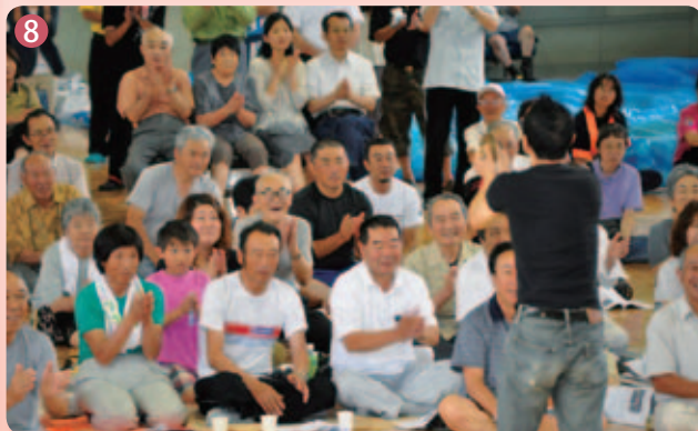
表紙:「太鼓フェスティバルin騎西」にて