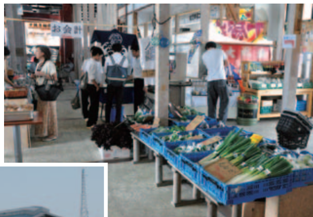
修復して仮営業を開始

「おかげさまで、被災前の従業員を一人も解雇することなくがんばってこることができました。あまり先のコトを考えないようにしています