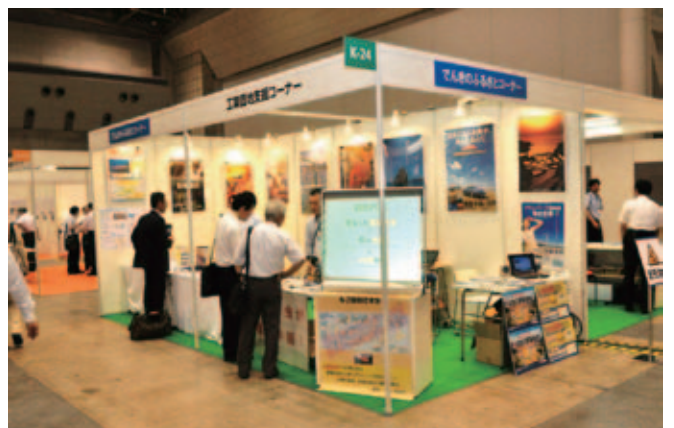
東京ビッグサイト内に開設されたブース