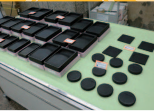
瓦礫の中から回収した碓を仙台の七夕で販売

が有名だが、日本の書道家の間では『和硯に和墨』という言葉があるように、国産の書道用具が愛され、雄勝硯もその一つとされる。