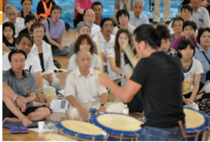
太鼓に聞き入る双葉町の皆さん