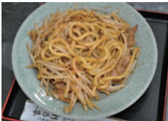
もちもちした歯ごたえの「なみえ焼そば」

への出店を市に掛け合ってくれたのです。二本松の友人たちには感謝してもしきれないほどです」 しかし、避難先での出店である。手持ちの資金はなかった。「前のオーナーからテーブルや椅子を無償で譲ってもらい、開