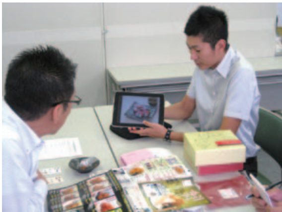
田辺市で開かれた現地相談・商談会

地へ伺い、事業者の方々と個別の面談・製品の評価やアドバイスを行ったもので、「消費者の求めるもの、流通の現状、他地域の取組事例」など、リアルタイムな情報を基に今後の方向性を共に考える場となりました。