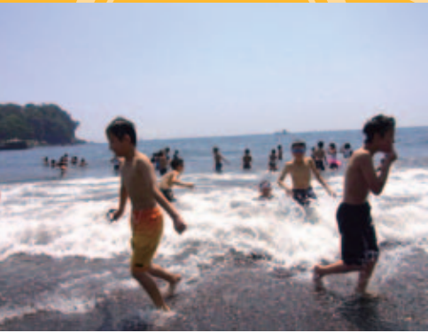
赤座海岸で遊ぶ広野町の子どもたち