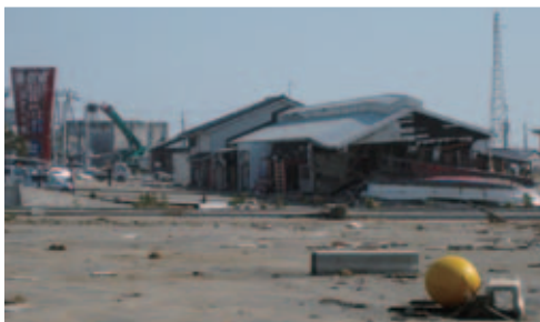
流された船が激突して大破した建物

「道の駅よつくら港」の営業中の看板は、いわきの復興に向けて、地域住民に元気を届けているように思えた。