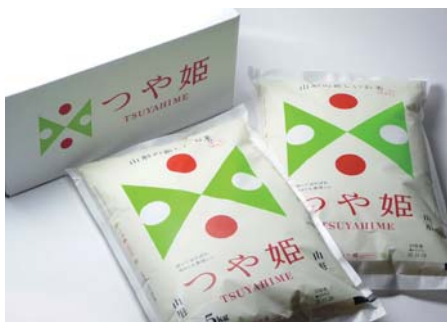
鶴岡市で生まれたブランド米『つや姫』

【お問合せ】 電気のふるさと編集室 ☎03-6372-7305 ホームページ：http://www2.dengen.or.jp/html/leaf/furusato/enquete.html