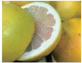
佐賀大学で研究して全国で初めて品種登録された「さがんルビー」

を持つている。唐津市内にある農学部付属の「アグリ創生教育研究センター」には、原材料を抽出・保存する装置があり、また、国立大学で初めて「オーガニック認証」を受けている。