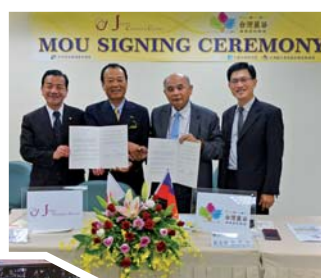
台湾のビューティパレとの調印式

遺産になりましたが、『メイド・イン・ジャパン』の化粧品素材はブランドになります。佐賀が健康美容産業の集積地であり、世界の拠点となるようにしていきたい。唐津という一地方から、人の生き方を含めて世界に発信していく可能性は十分にありまます」