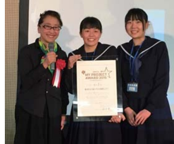
「全国高校生マイプロジェクトアワード2015」の学校部門で、文部科学大臣賞を受賞した唐津東高校