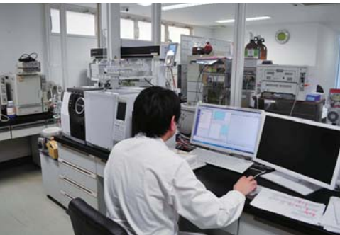
【上】(株)ブルーム、【下】(株)ブルームの検査室

「実は私も、以前からイメージはあったんです。唐津はもともとアジアに近い港町です。アジアの化粧品市場開拓を考えると、ヨーロッパからの輸送コストが高いことや、日本の製造技術の高さは大きな利点です。また、豊かな水や土壌から生まれる農産物もあり