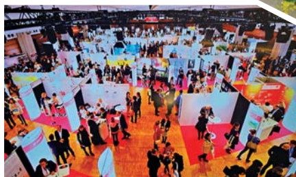
フランスのパリで開催されている展示商談会「Cosmetics 360」に出展

これらを背景にした高度な製造技術や産品それ自体が、ブランドであるというの「日本の唐津」というブランドとにも商品売って行かねばならないということだ。事実、JCCのホームページには唐津の伝統文化が多く紹介されている。また会員企業の中には観光業者も参加している。「唐津コスメティック構想」には、単に化粧品の産業集積にとどまらず、海外からの交流人口を引き込み、北部九州の一大産業集積地にしよという、壮大な心意気が潜んでいるのである。