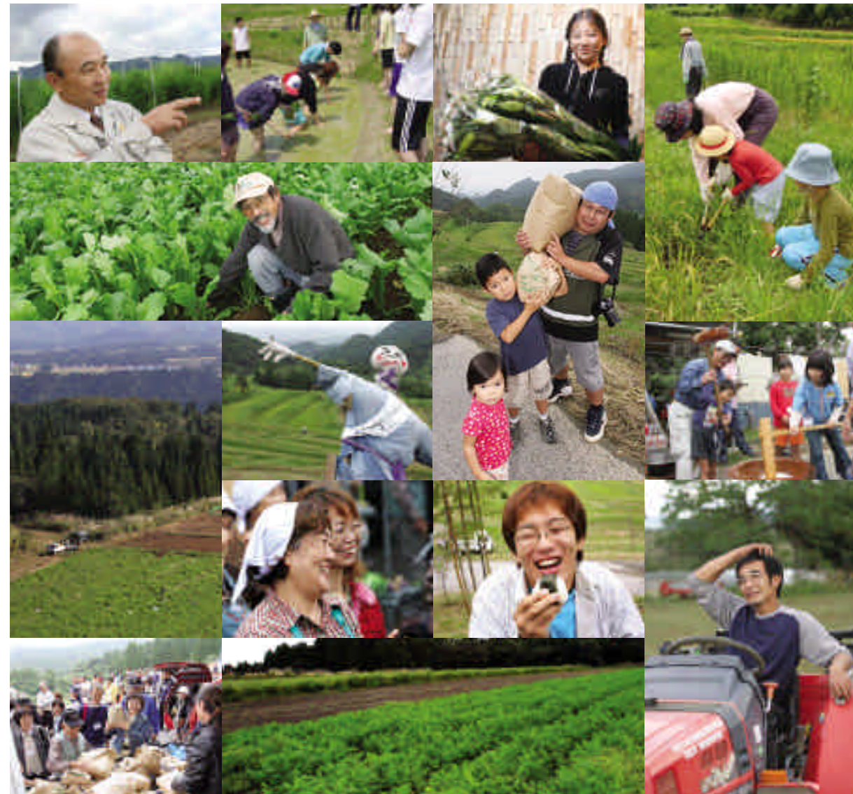
本誌の取材にご協力いただき、ありがとうございました

電気のふるさと応援マガジン 地域のひろば 通巻百八十八号 平成十六年十一月二十日発行 発行・財団法人電源地域振興センター