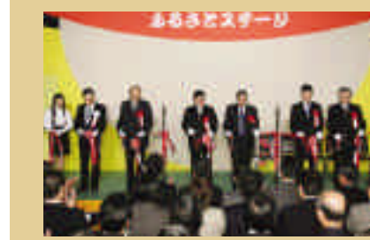
ふるさとスーパードレスアップ

去る十一月十九日(金)から二十一日(日)の三日間、千葉市の日本コンベンションセンター(幕張メッセ)にて第十五回「電気のあるむじまん市」を開催いたしました。「日本最大の観光・物産展」として、今回も二百以上の出展市町村と約十一万人の来場者を迎えました。