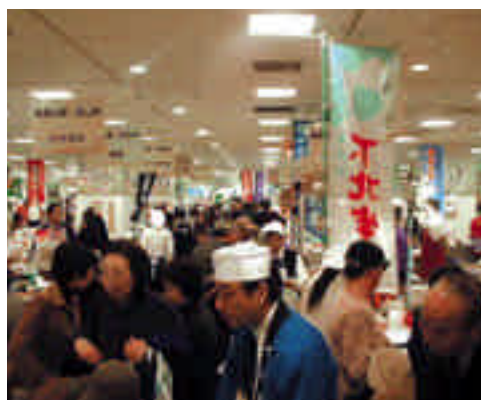
昨年の広島での会場風景

平成十七年三月二十五日より愛知県で開催される「愛・地球博」にあわせ、五月十九日（木）～二十三日（月）の五日間、名古屋市のささしまサテライト会場にて「電気ふるさとじまん市 名古屋」を開催します。北は北海道、南は沖縄まで八十九所を超える電源地域市町村が出展する予定です。皆様のお越しをお待ちしております。