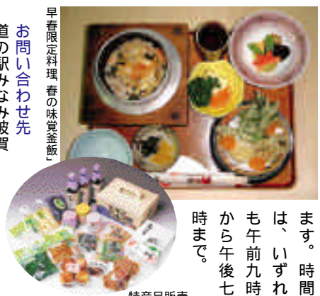
早春限定料理「春の味覚釜飯」が味わえます。時間 は、いずれも午前九時から午後七時まで。

早春限定料理「春の味覚釜飯」が味わえます。時間 は、いずれも午前九時から午後七時まで。 お問い合わせ先 道の駅みなみ波賀 （株）波賀メイトル公社「担当：春香」 0790753999 ホームページ http://www.jihenyo.com/minamiha/