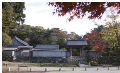
◀ 国指定史跡「石動山」