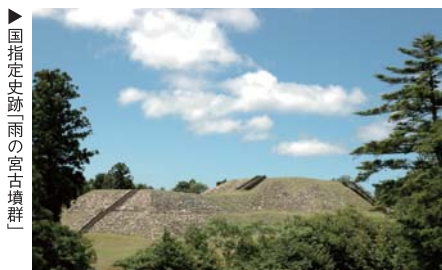
▶ 国指定史跡「雨の室古墳群」