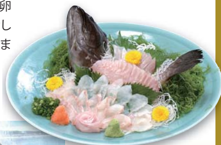
『御前崎クエ』の姿造り

【お問合せ】御前崎クエ料理組合 ☎0548-63-2001 (御前崎市観光協会内) 【URL】 http://www.omaezaki.gr.jp/