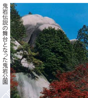
鬼岩伝説の舞台となった鬼岩公園

【開催日】2月11日(土・祝)・2月12日(日) 【会場】飯山市城北グラウンド周辺 【お問合せ】いいやま雪まつり実行委員会 ☎0269-62-0156 【URL】 http://www.isnowfes.org/index.php