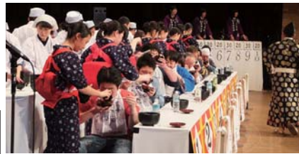
熱気あふれるわんこそば競技

わんこそば発祥の地ともいわれている花巻市で、毎年開催される「元祖わんこそば全日本大会」は、行司姿の審判と力士ならぬ“食士”が登場する、まさに“食の格闘技”です。大食い・早食いのイメージが強いわんこそばですが、本来は温かいそばがのびないよう少量ずつ給仕するという、お客さまへのおもてなしの心を大切にされた郷土料理です。イベントでは、そばにあう地場産品グランプリ、台湾フードコーナー＆物産コーナーなど、“食士”でなくとも楽しめる催しも用意されています。