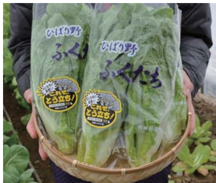
幻の野菜『ふくたち』

【お問合せ】JAうご ☎0183-62-1120 【URL】 http://www.ja-ugo.jp/sub_nou/fukutachi.html