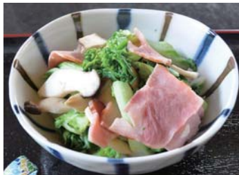
ふくたちとベーコンの炒め物