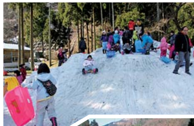
子供たちに大人気のBIGソリスベリ台

「美浜冬まつりin新庄」は、美浜町新庄地区の『溪流の里』で開かれる冬まつりです。雪山での謎解きウォークラリーや冬の溪流釣り、スノービークル体験などのアトラクションは、子供たちに大人気の催しとなっています。その他、ステージイベントが催されるほか、「お菓子まき」、「つきたて餅ふるまい」など、盛りだくさんのイベントです。屋台では、温かい食べ物やホットドリンクも用意して、皆さんのお越しをお待ちしております。海だけではなく、美浜の雪山の魅力も楽しめるイベントとなっています。