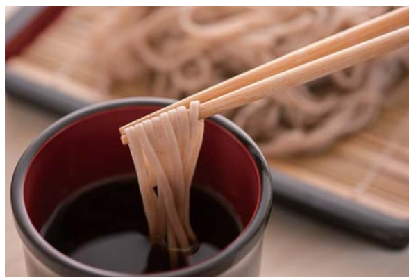
本格的な十割そばをご賞味ください