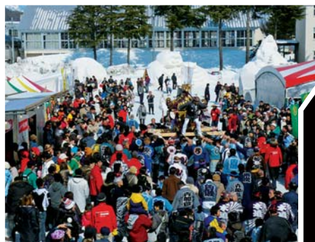
大勢の人で賑わう会場