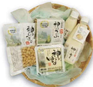
神倉大豆を使用した商品