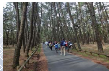
日本の三大松原に数えられる「虹の松原」でのウォーキング