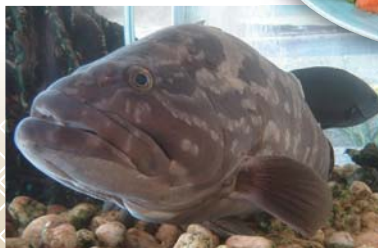
完全養殖に成功した『御前崎クエ』

御前崎市内の「静岡県温水利用研究センター」では、卵からクエの稚魚を育てる「完全養殖」に成功し、小型でおいしい生後1～2年の『御前崎クエ』を市内各店へ提供しています。身は透明感があり、しっかりとっていて、刺身にする、その食感の良さのなかに旨味が感じられます。また、鍋の具材としても人気です。『御前崎クエ』を使用した料理は、旬となる11月から3月まで、市内の各取扱店で味わうことができます。御前崎の冬の味覚を、ぜひ一度ご賞味ください。