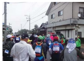
毎年大勢の参加者が集う

【開催日】3月18日(土)・19日(日) 【会場】浜玉公民館 【お問合せ】一般社団法人 唐津観光協会 ☎0955-74-3355 【URL】 http://www.karatsu-kankou.jp/