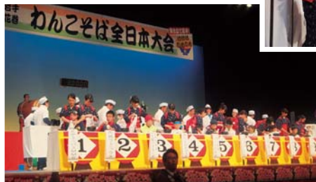
わんこそば競技小学生の部