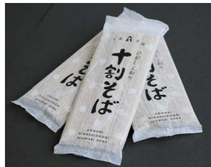
新商品『ひがしどおり十割そば』