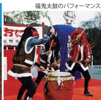
福鬼太鼓のパフォーマンス