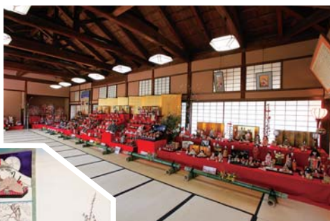
様々な雛飾りが座敷を彩る

【開催日】2月25日(土)～3月12日(日) 【会場】倉敷市内 【お問合せ】倉敷雛めぐり実行委員会事務局 ☎086-421-0224 【URL】 http://kankou-kurashiki.jp