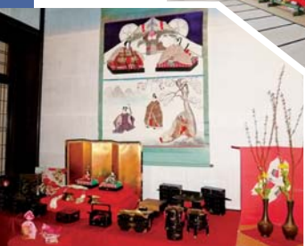
珍しい雛人形にも出会えます