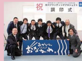
「復興まちづくり女川合同会社」による「女川プランニングプロジェクト」の調印式 (2012年9月)