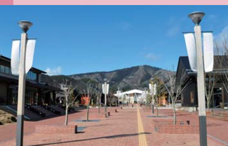
イベントなどで内外の人々が 自由に使える空間となってい る駅前のレンガみち

ということだと思います。 先の震災では、当たり前前 に思っていたことを一瞬で無くして、当 たり前がいかに脆いものであるか を知りました。それでも、また新 しい当たり前を作ろうとしてやっ てきています。それもいつ失われ るか分からないのですが、「そ れでも立ち上がるんだ」というポ ジティブなメッセージを発信して いける場所が、ここにあります。 ぜひ一度、女川町を訪ねてみてく ださい。心からお待ちしております。 (談)