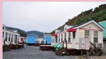
トレーラーハウス宿泊村「エルファロ」オープン (2012年12月)