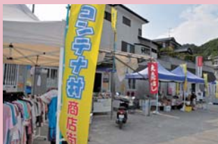
商工会有志で立ち上げたコンテナ村商店街 (2011年8月)