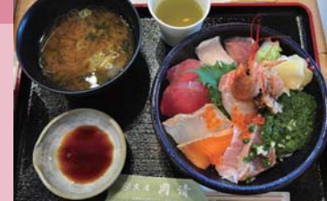
観光客に人気の「女川丼」