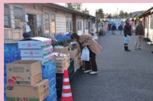
木造仮設店舗「きぼうのかね商店街」をオープン (2012年4月)