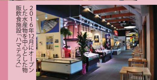
2016年12月にオープン した水産物を中心とした物 販飲食施設「ハマテラス」