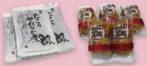
第41回宮城県水産加工品 品評会で受賞した水産加工品