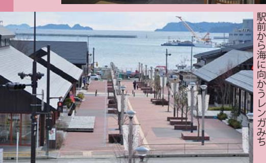
駅前から海に向かうレンガみち