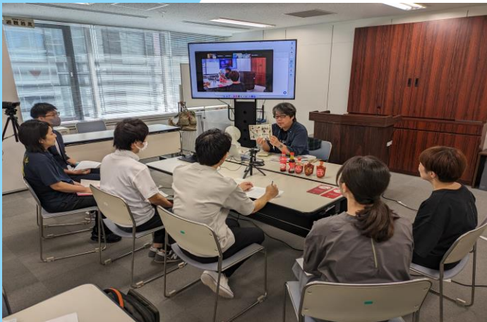
6次産業化とブランディング研修の様子 「いなかの商品開発とデザインを考えよう」